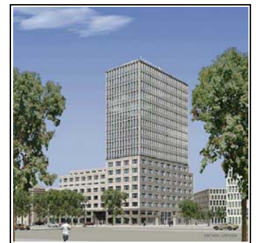
Bürogebäude Straße des 17. Juni 106 - 108 Entwurf: Ortner & Ortner