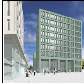
Verbändehaus Wegelystraße Entwurf: Heinle, Wischer & Partner