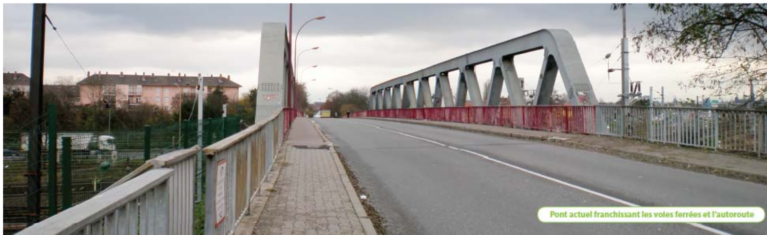
Vue de l'ouvrage actuel